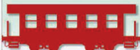
Il tabellone di Bardonecchia e dintorni