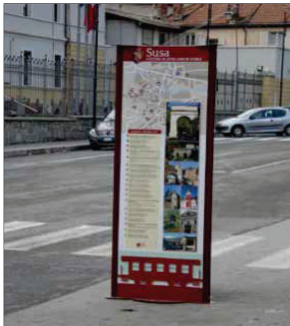
Un pannello posizionato nelle vie di Susa

Apparve indispensabile unire le forze di tutto il volontariato culturale per provare a proporre e realizzare insieme alcuni progetti di ampio respiro. Ci si indirizzò allora a creare una cabina di regia inter-associativa per definire i progetti da seguire, per stabilire chi facesse che cosa, come e quando; per verificare la progettazione in dettaglio; per ricercare i contributi necessari a sviluppare i progetti; per attivare tutti gli aiuti utili a realizzare