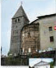
Chiesa di S. Michele. Veduta dall'alto.