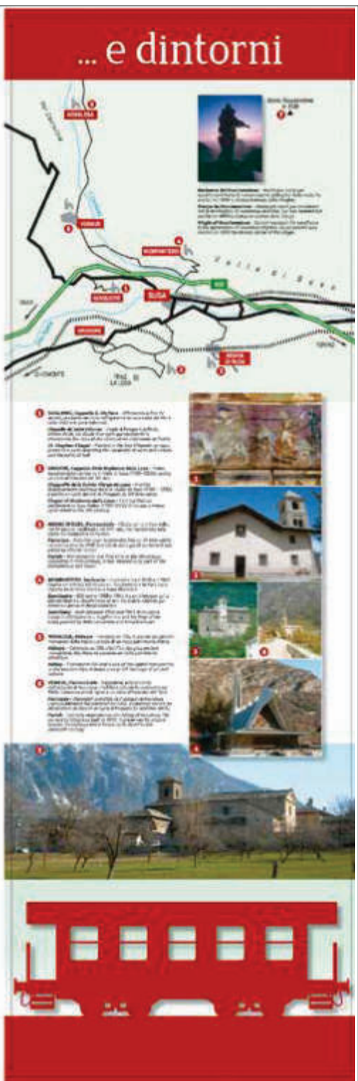
Il tabellone di Susa e dintorni