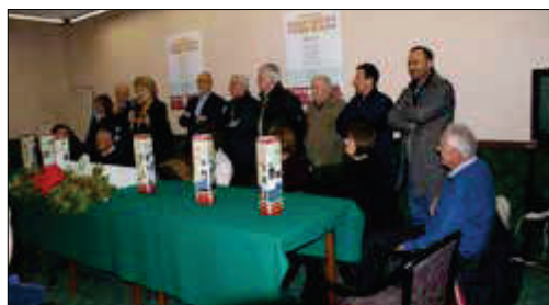
Due momenti della serata di presentazione del progetto a Susa

Prossima stazione... Arte e Cultura in Valle di Susa , Estratto dal Quaderno n. 10