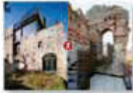
Castello di S. Marco. Veduta dall'alto.