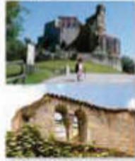
Castello di S. Marco. Veduta dall'alto.