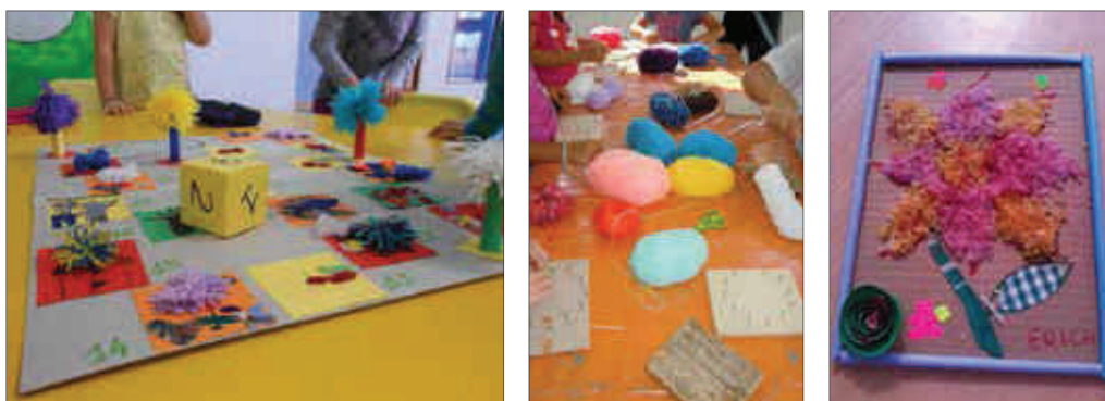
Laboratori presso "Il filo racconta"

Con l'intento di far meglio conoscere la realtà del Villaggio Leumann e la sua storia, quest'anno si è pensato di realizzare un giardino di Piante Tintorie e Tessili.